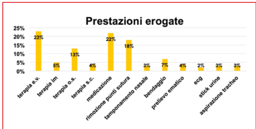
Figura 2. Prestazioni erogate presso l'ambulatorio infermieristico